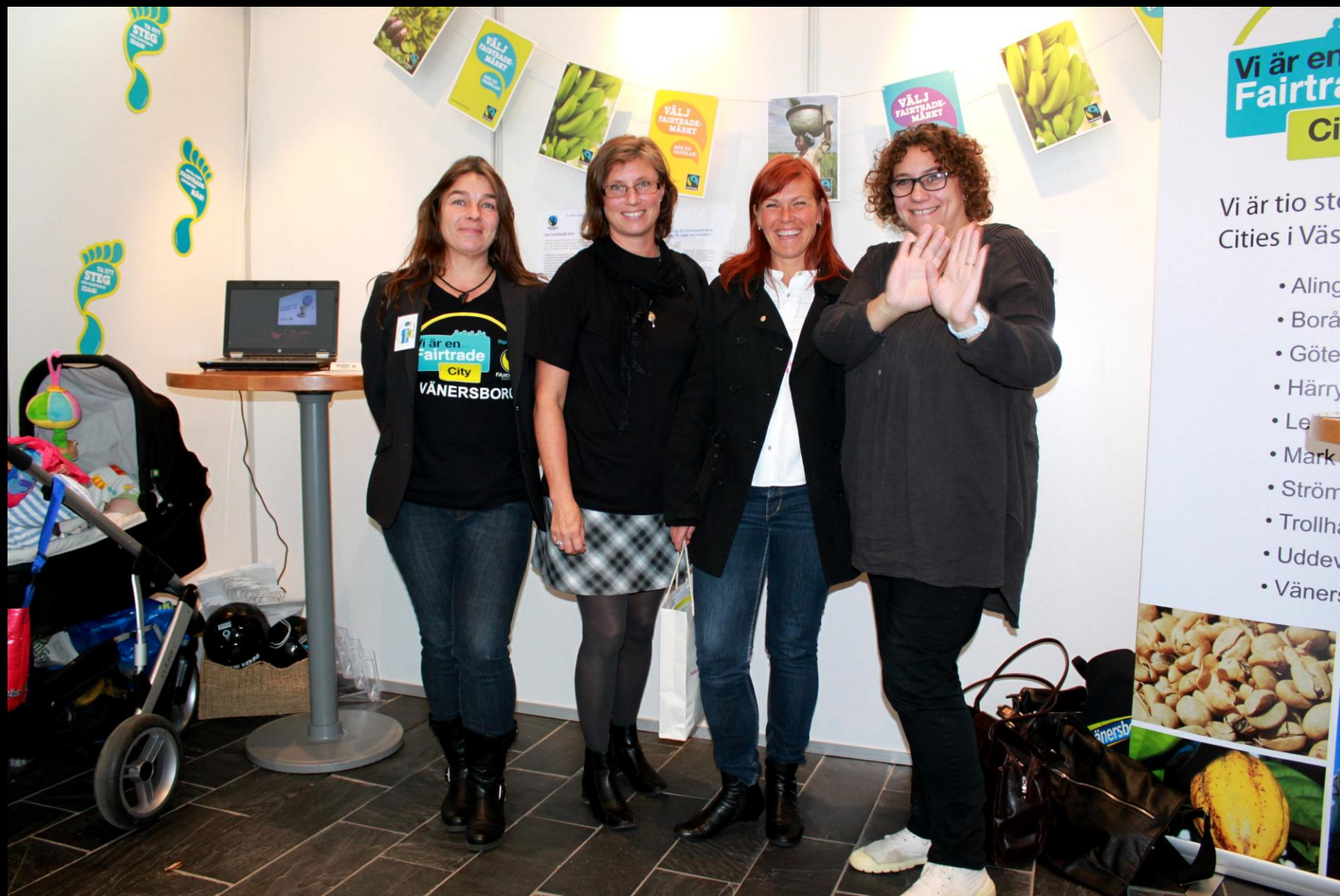
Fairtrade Forum, Borås Vänersborg, Trollhättan, Härryda och Göteborg