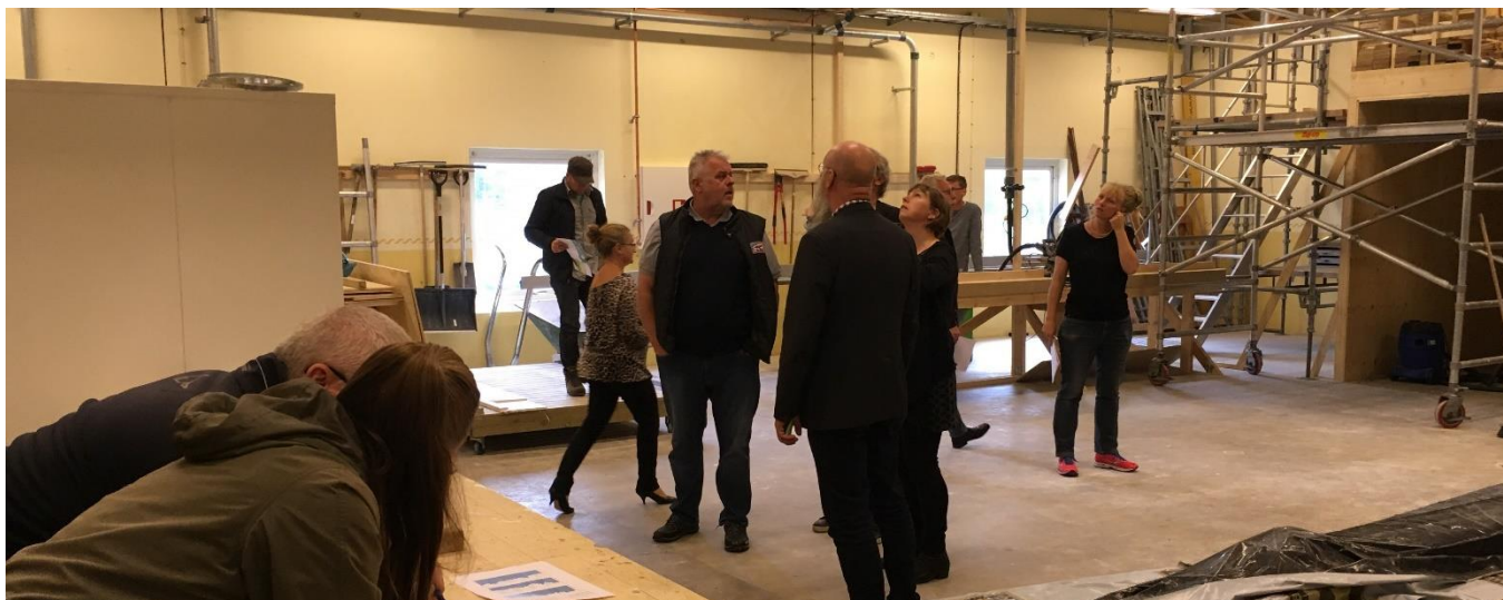
På observationsrunda Ölltorp höst 2017