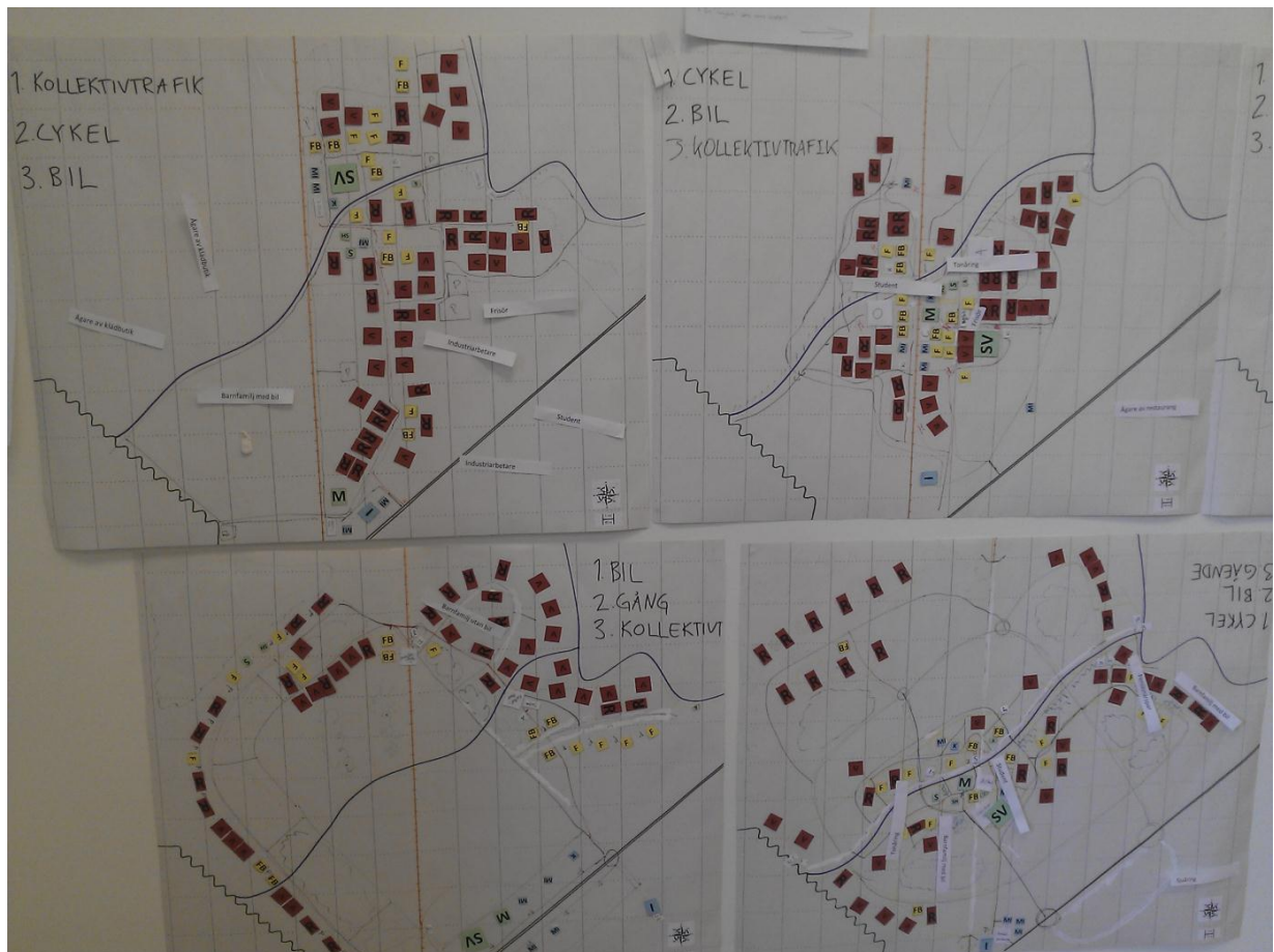
Figur 2-3 – Exempel på klara områden