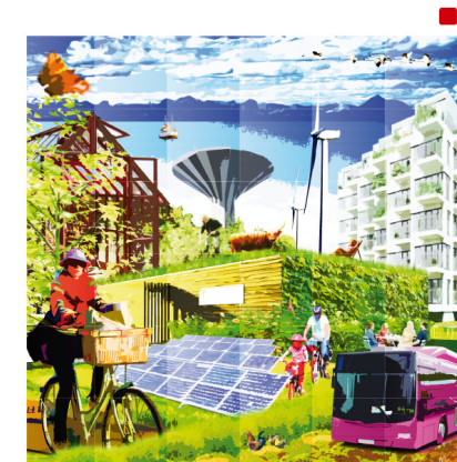
Klimatplan för Örebro kommun